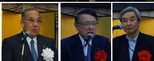
（写真左から）開会挨拶する石井会長、ご来賓のご挨拶を頂戴した丹羽衆議院議員、鎌形環境省廃棄物・リサイクル対策部長